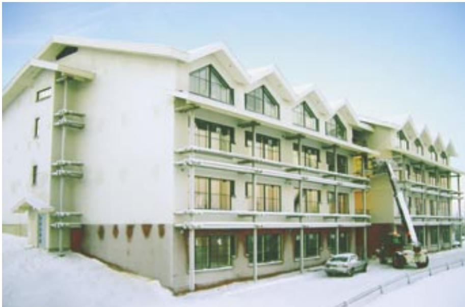
Hotelli Olos on YBT:n uusimpia matkailukohteita.