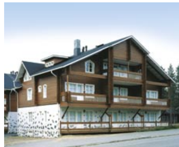
Liuskekivi elävöittää betonin pintaa. Kuvassa Kultarinne.

Muihinkin pohjoisen matkailukohteisiin on rakennettu Parasta Betonista. Esimerkiksi Ylläksen ja Oloksen uudet hotellirakennukset valmistuivat viime kesänä. YBT rakensi Ylläkselle pienhotellin ja Olokselle todella upean 56 huoneen hotellin, johon toimitettiin yli 1000 elementtiä asennettuna.