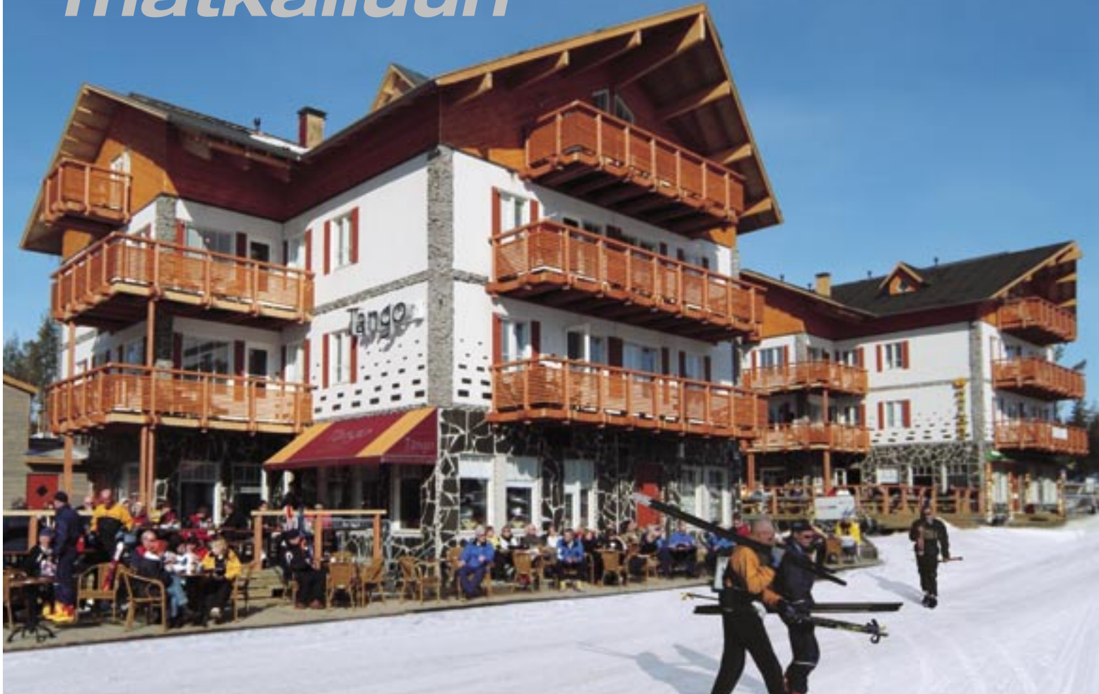
YBT on valmistanut 25 alppitalon elementit Leville.

Lapin matkailukohteiden rakentaminen on tarjonnut YBT:lle paljon töitä. Yksi laajamittaisimmista projekteista on ollut elementtien toimittaminen Levin alppitaloihin sekä useisiin hotelleihin samalla alueella.