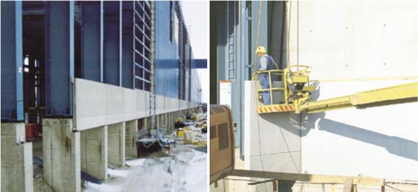
YBT Oy on toimittanut Outokumpu Stainless Oy:lle kaikkiaan n. 4000 erilaista betonituotetta, pääosin paikoilleen asennettuina.

Teräksen ja betonin liitto on vuosien varrella osoittautunut kestäväksi.