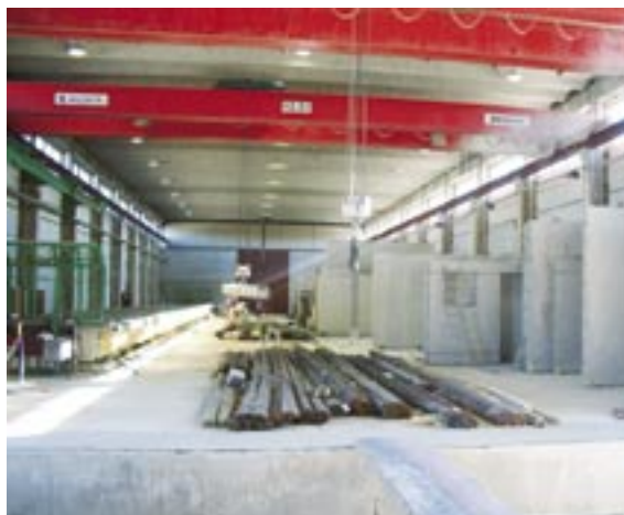
YBT:n Ylitornion tehtaan hallitilan laajennus, joka valmistui alkuvuodesta 2004. Tilassa sijaitsee TT-laattamuotti sekä elementivarasto.