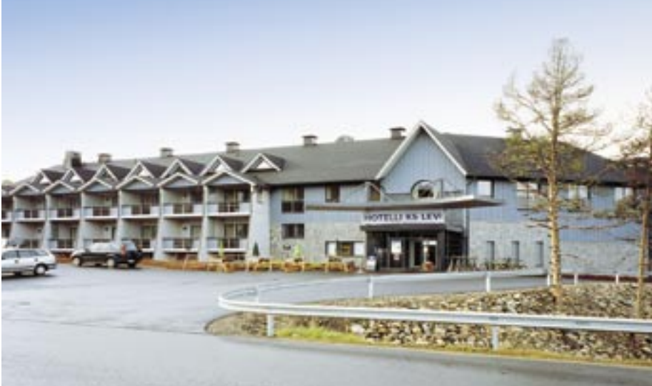
Hotelli K5:n elementit ovat YBT:n käsialaa.