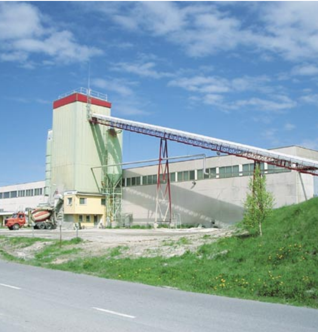
YBT Oy on vuokrannut Raahan betonielementtitehtaan noin 2000 neliön tuotantotilat Ruskon Betoni Oy:ltä.

YBT avasi Raahen uuden tuotantolaitoksen kesäkuun alussa 2004. Tuotannollinen toiminta alkoi heti. Raahen tehdas on kooltaan noin puolet Ylitornion tehtaasta.