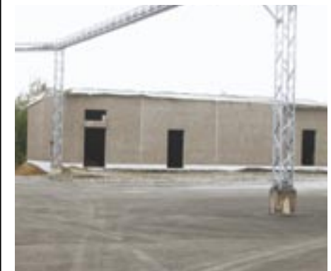
Raahen ensimmäinen työkohde oli Pohjanmaan PPO Oy:n laitehalli Raahessa.

– Seuraavaksi suunnitelmassa on hankkia tänne uusia elementtipöytiä. Niiden avulla saataisiin nykyistä isompaa elementtiä tulemaan.